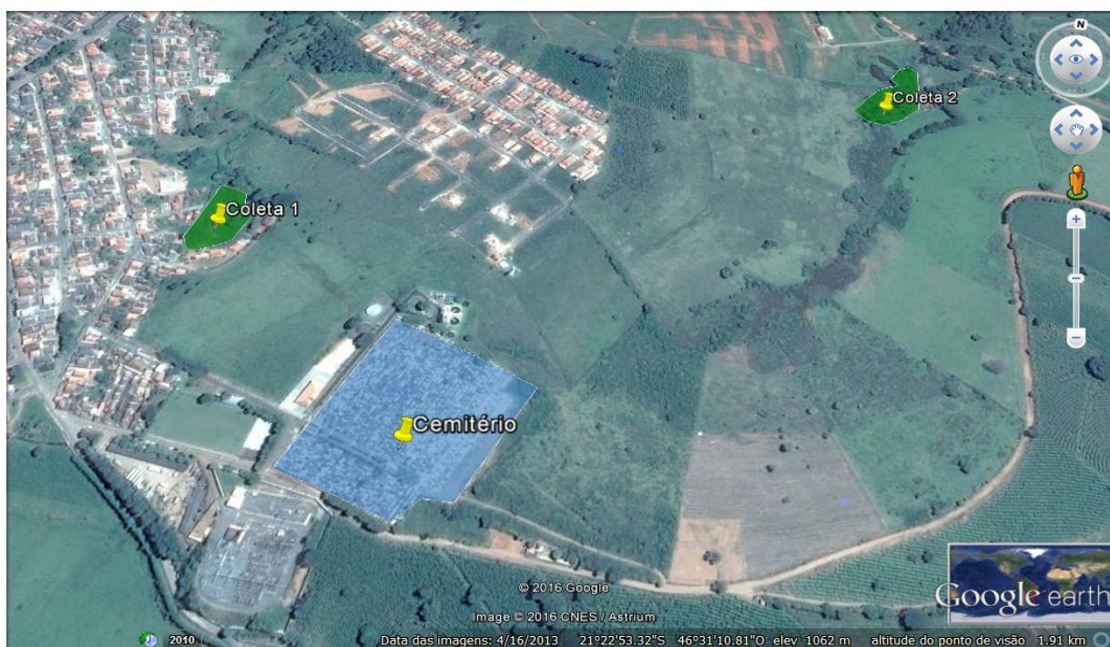
Figura 1 - Localização do cemitério e áreas de coleta.

O estudo foi realizado em duas nascentes próximas ao cemitério municipal da cidade de Muzambinho, com as respectivas referências, conforme a Figura 1, com os nomes “Coleta 1” com altitude de 1040 metros e a “Coleta 2” com altitude de 1010 metros, ambas abaixo do nível do cemitério. As duas nascentes não fazem parte do abastecimento de água do município, mas existem relatos de utilização dessa água para irrigação de hortas e na alimentação de ruminantes.